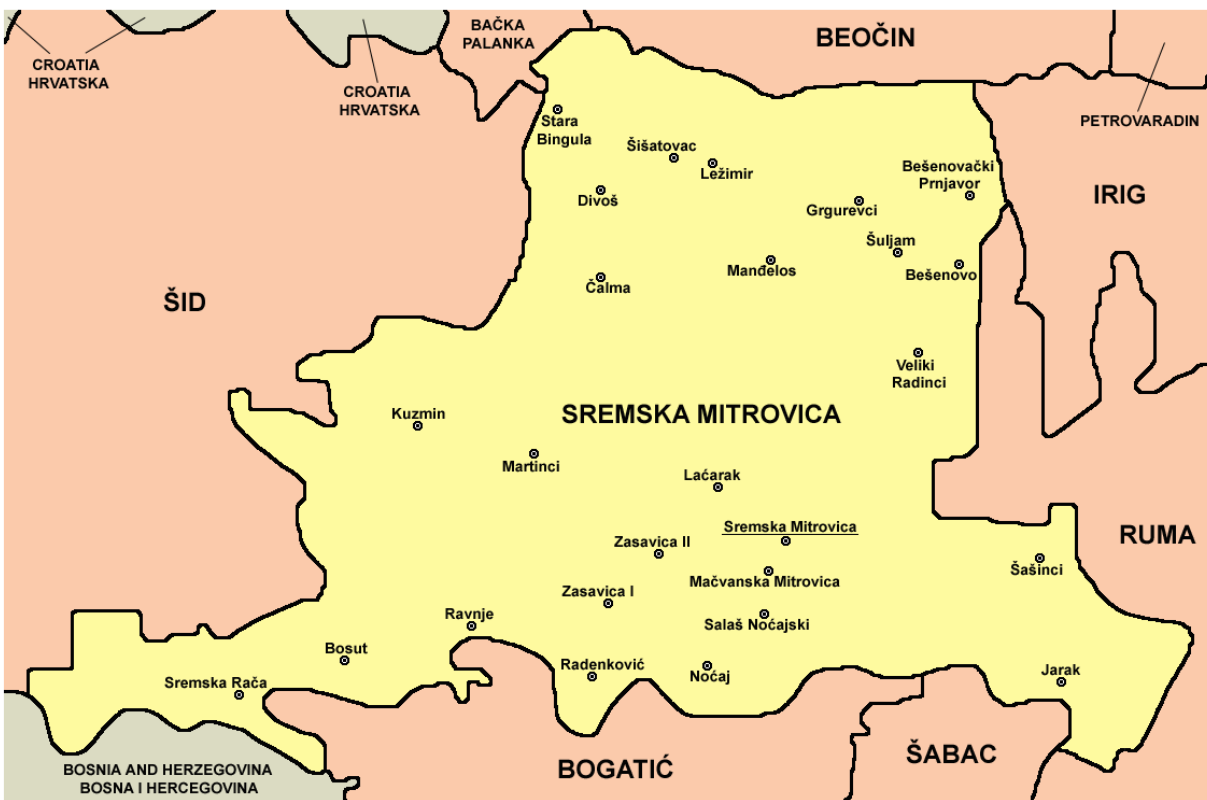
City of Sremska Mitrovica / Grad Sremska Mitrovica

После Другог светског рата од 220 кућа само три нису изгореле. 1953. године подиже се месна заједница, пошта и ветеринарска амбуланта. Од 1958. до 1960. село је добило нисконапонску мрежу. Од 1954. до 1960. село је асфалтирано око 7 km кроз село. 1964. изграђена је здравствена амбуланта, а 1975. изграђен је локални водовод.