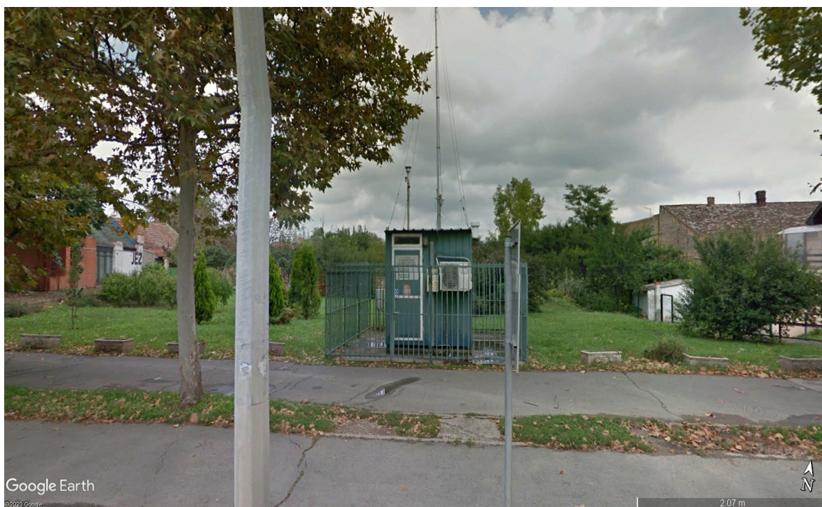
Mikrolokacija merne stanice „ZRENJANIN SAOBRAĆAJNA“