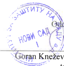
Goran Knežević, diplomirani inženjer tehnologije Rukovodilac departmana za ekotoksikološka ispitivanja