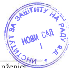
Goran Knežević, diplomirani inženjer tehnologije Rukovodilac departmana za ekotoksikološka ispitivanja