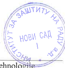
Goran Knežević, diplomirani inženjer tehnologije Rukovodilac departmana za ekotoksikološka ispitivanja