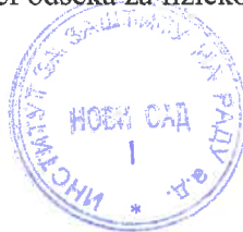
Goran Knežević, diplomirani inženjer tehnologije Rukovodilac departmana za ekotoksikološka ispitivanja