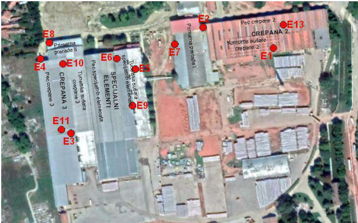
Слика 3. – Положај емитера у ваздух у оквиру комплекса AD POLET Industrija građevinske keramike Novi Bečej