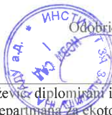
Goran Knežević, diplomirani inženjer tehnologije Rukovodilac departmana za ekotoksikološka ispitivanja